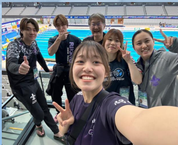
▼▲出場した選手とマネージャー