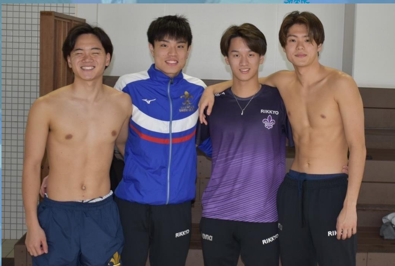
▲立教新記録を樹立した 男子メドレーリレーメンバー