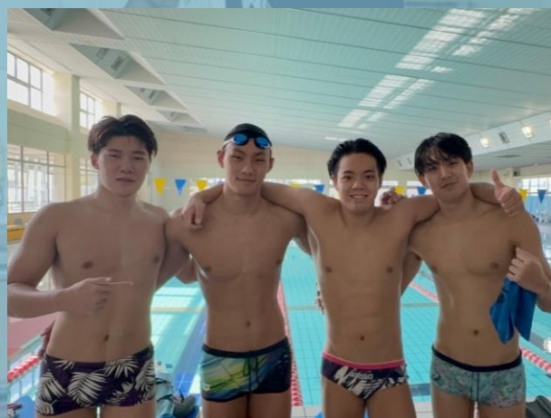
▲地元の高校生との記念撮影