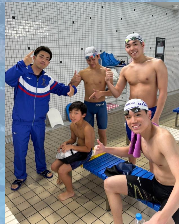
▶ レース前に交流する選手たち