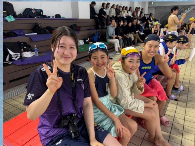
部員たち ◀ 小学生と交流する