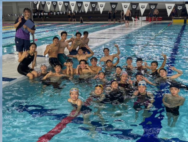
集合写真 ◀ リレーチームでの