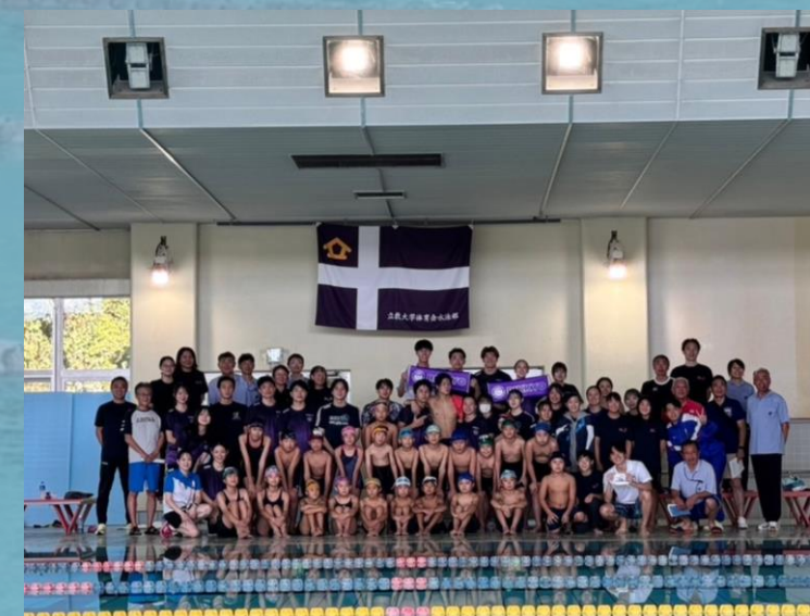
▲記録会の集合写真