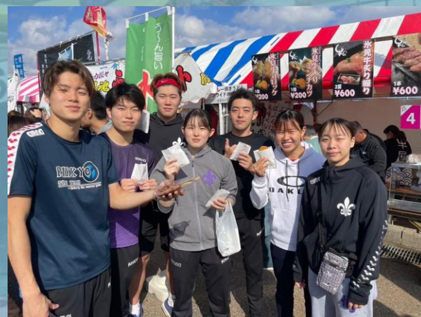
▲ひみ食彩まつりを 楽しむ部員たち