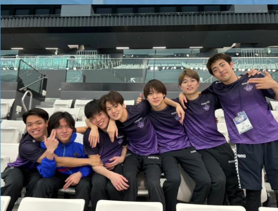
▲自己ベスト更新者