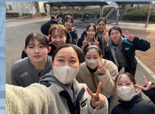
▲来年度入部予定者と 女子選手