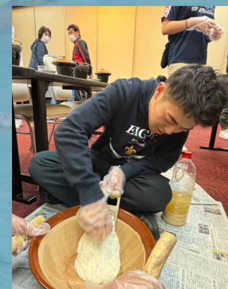
▲自然薯づくりをする 1年宮城